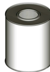
С ВЕРХНИМ ЗАКАТАННЫМ ДНОМ ПОД ПЛАСТИКОВУЮ ВСТАВКУ