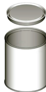
С ПРИЖИМНОЙ КРЫШКОЙ